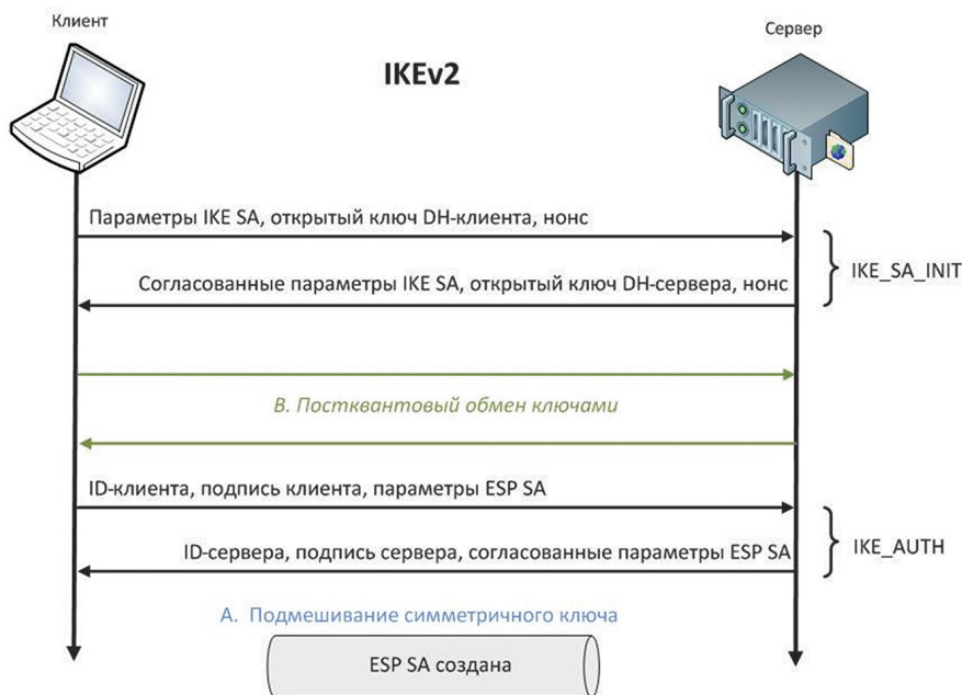
Рис. 3. Варианты противодействия квантовым компьютерам в IKEv2.

достаточно скоро, по некоторым прогнозам в пределах 20 лет (такая оценка, например, дается в меморандуме NIST (National Institute of Standards and Technology), опубликованном в апреле 2016 года).